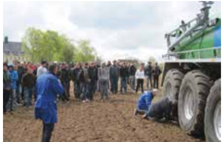
Landmaschinenschule – Aus- und Fortbildung Landtechnik