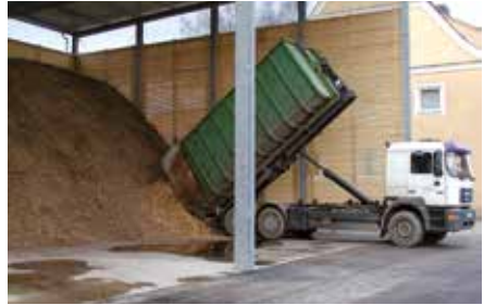
Biomasseheizwerk Bayreuth GmbH Wärme und Strom