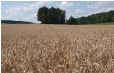
Bezirkslehrgut – Außenwirtschaft