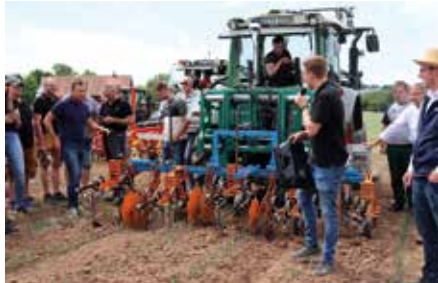
Aus- und Fortbildung Landtechnik