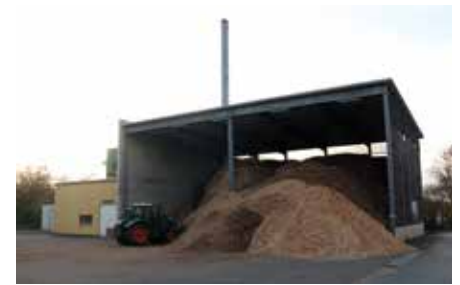
Biomasseheizwerk Bayreuth GmbH Wärme und Strom