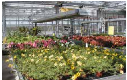
Landmaschinenschule Aus- und Fortbildung Gartenbautechnik