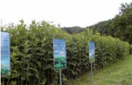
Bezirkslehrgut – Versuche