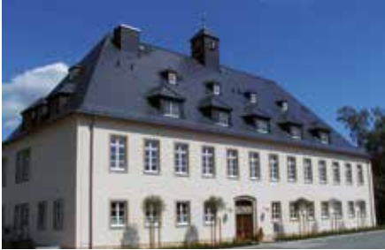
Verwaltung – Internat – Lehrsäle

Landmaschinenschule für landtechnische Aus- und Fortbildung in Landwirtschaft und Gartenbau • Bezirkslehrgut