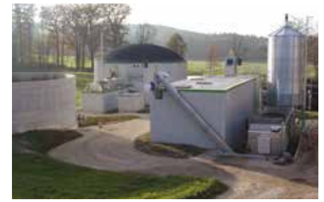
MR Bioenergie Bayreuth UG & Co. KG Biogas, Strom und Wärme