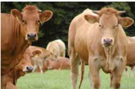
Bezirkslehrgut – Tierhaltung