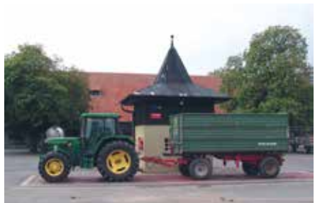
Bezirkslehrgut – Hofansicht