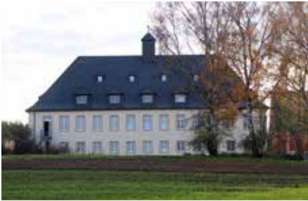
Verwaltung – Internat – Lehrsäle