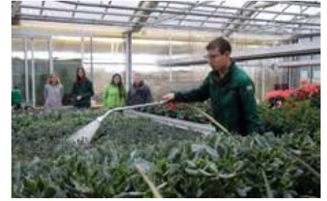
Aus- und Fortbildung Gartenbautechnik