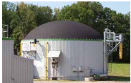
MR Bioenergie Bayreuth UG & Co. KG Biogas, Strom und Wärme