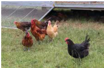
Tierhaltung – Schafe/Hühner